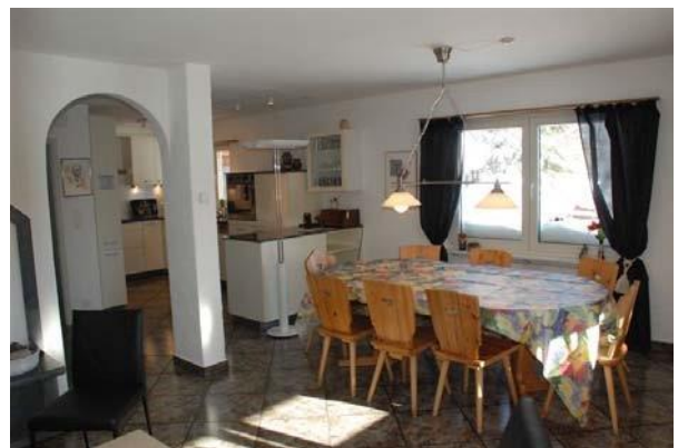
Wohn / Esszimmer