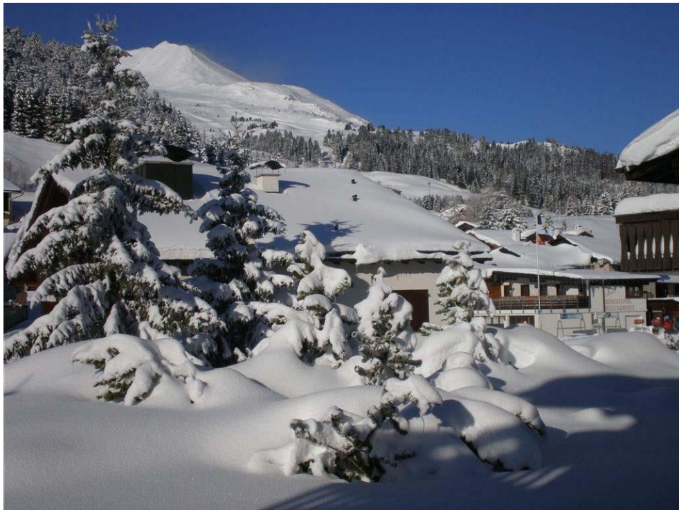
Aussicht vom Haus Richtung Alp Stätz