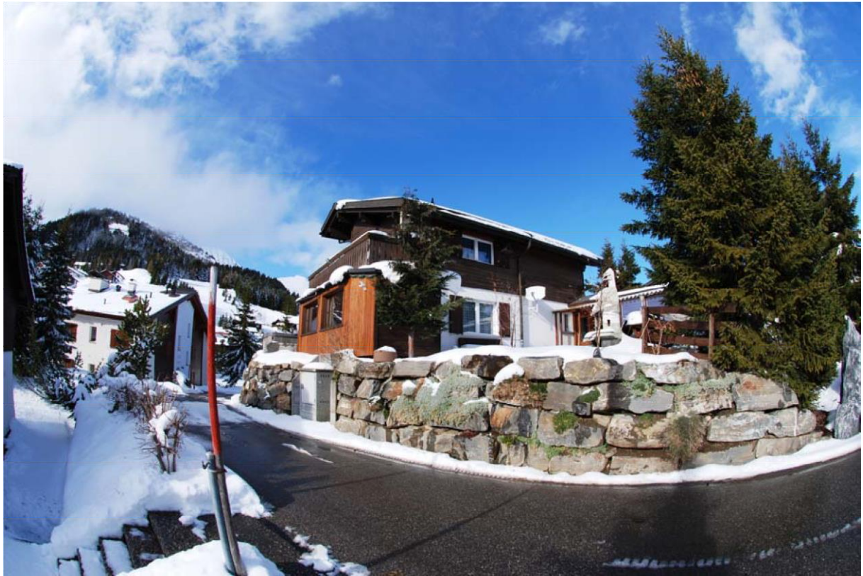
Casa Hofer Sartons