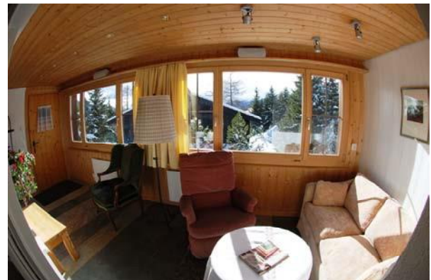
Wintergarten / Vorbau