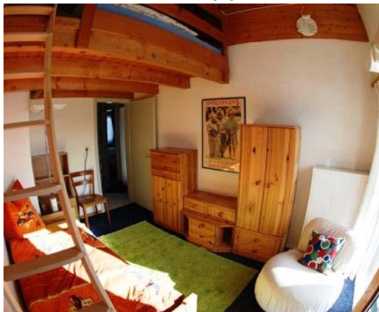
Galerie Zimmer mit Einzelbett